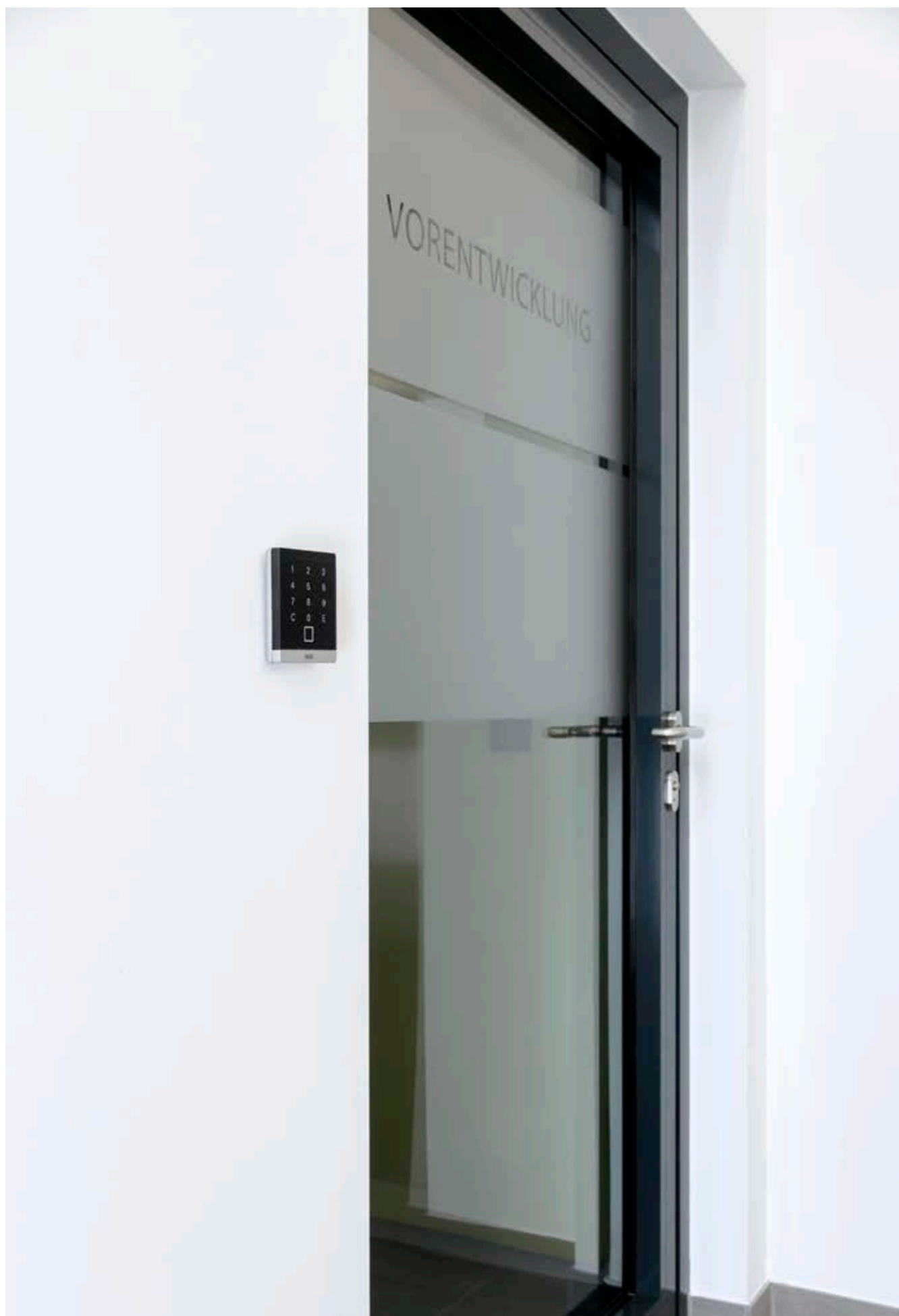
Einbausituation GCVR 800 Touch T, Deutschland