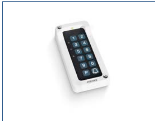
Toplock CTI B mit Beleuchtung