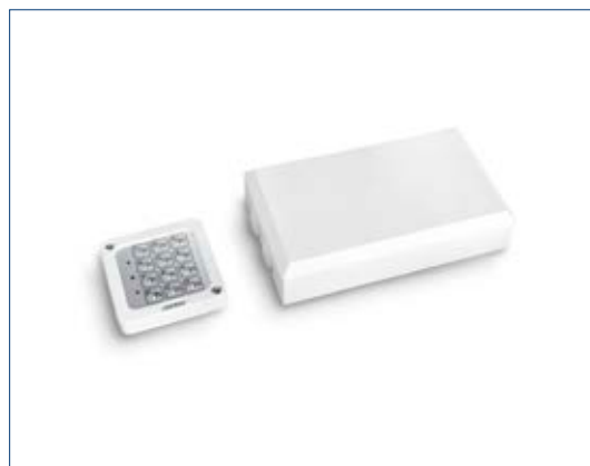
Toplock CTS BV mit Beleuchtung