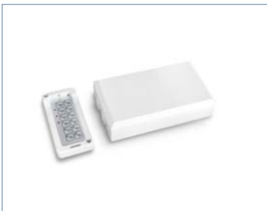
Toplock CTS V mit Metalltastatur