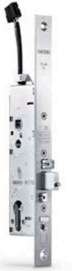
Motorschloss IQ lock EL DL