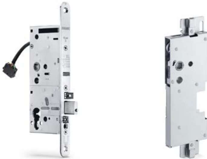
Elektromechanisches Motorschloss für die Kombination mit Drehtürantrieben an zweiflügeligen Türen