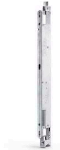
Stangenantrieb IQ AUT